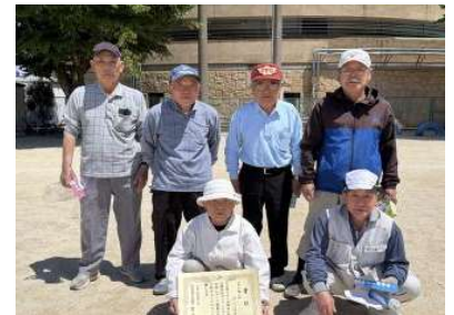
第3位 東大沼自治会