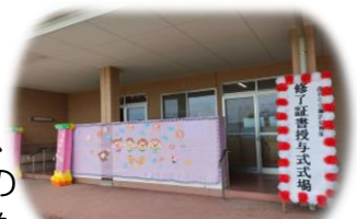
3月19日最後の修了式

卒園児や、これから市内の幼稚園へ通園する園児の皆さんは、藤沢幼稚園で過ごした思い出をいつまでも心に輝き続けて、4月からの新しい環境で楽しく過ごしてくださいね。