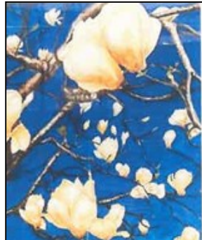
久美子さん < 白木蓮 F10 >