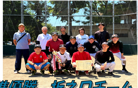
準優勝 折之口チーム

5月17日(日)、仙元山公園ソフトボール場にお いて、藤沢地区ソフトボール大会を開催しました。