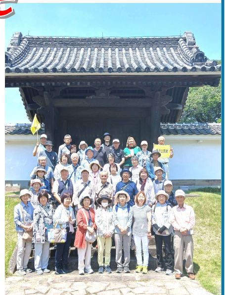
幕末の武士たちの学び舎 水戸弘道館