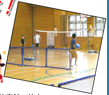
ひろーい体育館で体を 動かすのは楽しいね!