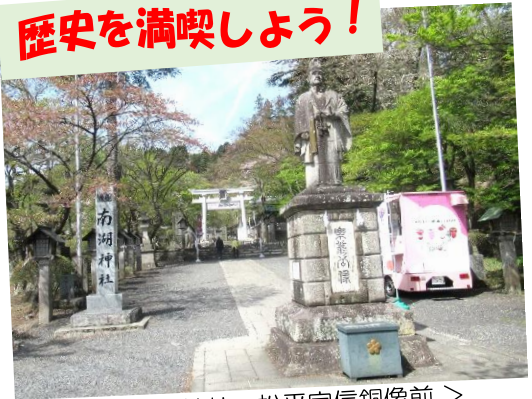
<南湖神社 松平定信銅像前>