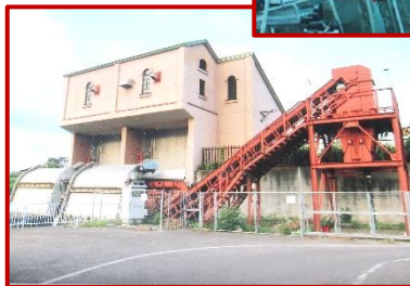
福川伏せ越しゲート

福川は流域面積約七十五、四平方キロメートルの一级河川です。福川の河川改修は、昭和三十七年から事業に着手し、河道の改修と唐沢川との伏せ越し工事が平成十三年度に完成。しかし、福川上流部の都市化が進んだことにより、降った雨が福川へ流出する量が増加しているため、平成十四年度から福川調節池の事業に着手。福川調節池は、増水した一部を一時的に溜めておく施設で、福川流域の浸水被害を減らす役割を