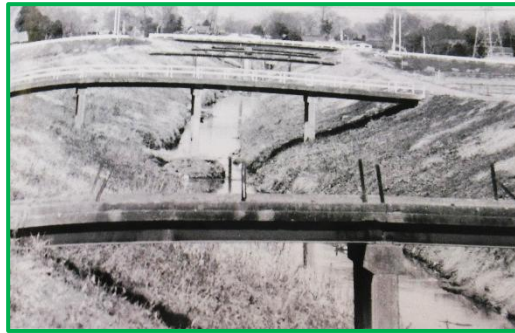
2号橋から5号橋方面をみる